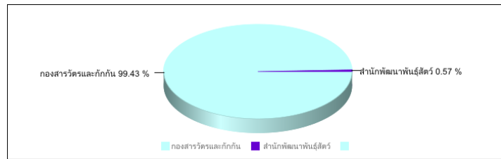
กราฟแสดงการส่งข่าวข้อความสั้น(SMS) เดือน กุมภาพันธ์ 2557

สรุปรายงานสถิติการส่งข่าวข้อความสั้น(SMS) เดือนกุมภาพันธ์ 2557